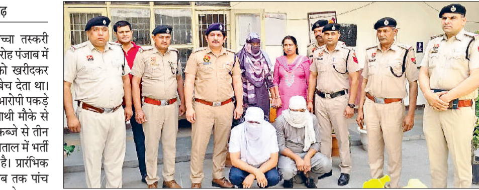
बहादुरगढ़। पुलिस की गिरफ्त में बच्चा तस्करी गिरोह के आरोपी।

फरीदकोट के दंपति से 2.25 लाख रुपये में तीन दिन का बच्चा खरीदा, दिल्ली में 9.25 लाख रुपये में बेचने का सोदा किया