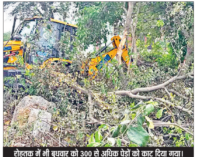
रोहतक में भी बुधवार को 300 से अधिक पेड़ों को काट दिया गया।

चंडीगढ़ एसएसपी कंवरदीप कौर ने कहा- हमें 5 बजे सूचना मिली थी कि पंजाब भाजपा दफ्तर के पास बम जैसी आवाज दूर तक सुनाई दी। सूचना के बाद टीम पहुंची है। एक कूड जैसी चीज फेंकी गई। एनआईए समेत जांच एजेंसी मौके पर पहुंच गईं। सेंटर फोरेंसिक की टीम, फाइंडिंग बाव की टीम पहुंची है। सारी जांच की जा रही है। अभी कुछ भी कहना जल्दबाजी होगी।