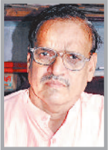
(लेखक भाजपा हरियाणा के प्रदेश अध्यक्ष हैं, ये उनके अपने विचार हैं।)