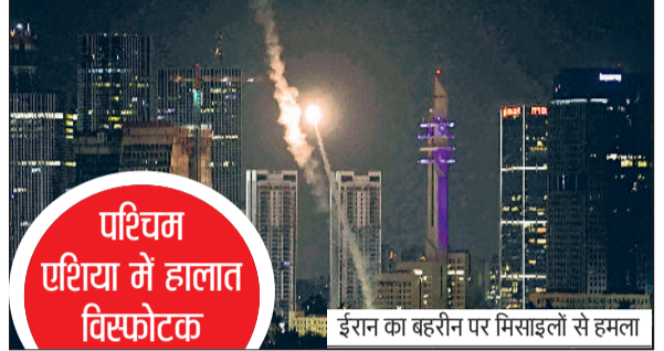
पश्चिम एशिया में हालात विस्फोटक

कतर तट के पास ईरान ने एक तेल टैंकर पर किया हमला